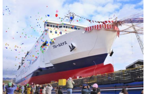
2020年1月9日進水式(内海造船機瀬戸田工場)