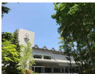
ホテル外観 (イメージ)