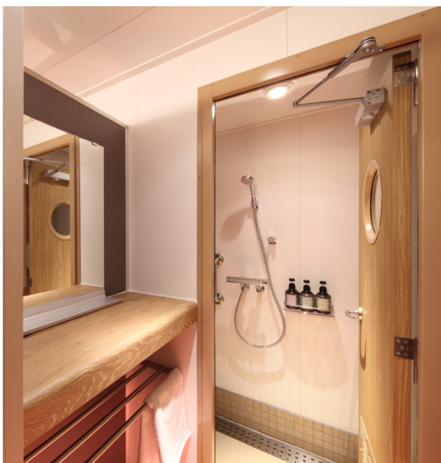
※写真は女性用シャワールーム